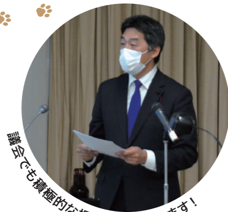
議会でも積極的な提言を続けています!