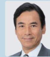
前衆議院議員 あくつ幸彦